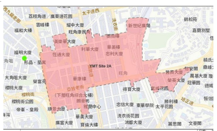
污水監測區域油麻地 2A (YMT Site 2A) 日期: 2022年1月30日 Date: 30 January 2022 圖號: 05-1P5A Drawing No:

由環境保護署與渠務署連同香港大學跨學科團隊，近日加強在各區採集污水樣本進行冠狀病毒檢測，發現於多個地區檢測到污水呈陽性，顯示可能有隱性患者。