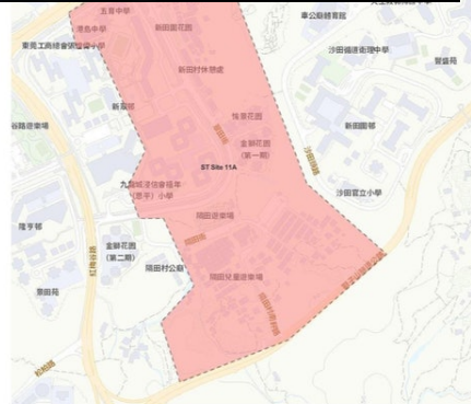
污水監測區域沙田 11A (Sha Tin Site 11A) 日期: 2022年1月30日 Date: 30 January 2022 圖號: 07-5111A Drawing No: