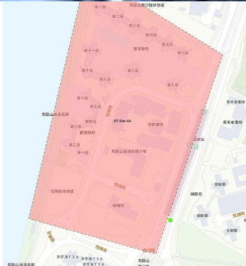
污水監測區域沙田 6A (Sha Tin Site 6A) 日期: 2022年1月30日 Date: 30 January 2022 圖號: 06-51 Drawing No: